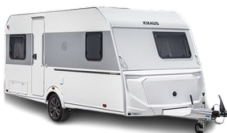
Travel 2 Personen