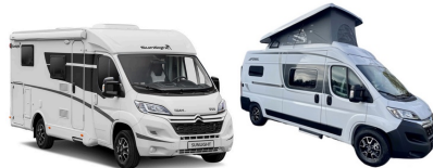
2 Personen Premium 4 Personen